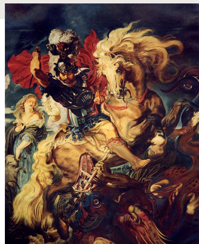
Fig. 2 - Pierre Paul Rubens : Saint Georges et le dragon, 1607 (musée du Prado, Madrid) Dans La légende dorée dont Rubens s'est inspiré, l'image est plus riche. Pour sauver la fille du roi promise fatalement au dragon, saint Georges à cheval maîtrise le reptile et le monte en ville pendant trois jours en le tenant en laisse avec la ceinture de la princesse 56 . Belle allégorie de l'interaction des différents niveaux de contrôle cérébraux, de leurs caractéristiques et de leur marge de manœuvre dont notre intervention tentera de restaurer l'équilibre.

Le dragon fulmine de n'être plus alimenté, et comme le cheval a figé sa contrainte violente et glacée, alors la douleur envahit tout l'équipage. Éclairons cette métaphore à partir du tableau de Rubens Saint Georges et le dragon exposé au musée du Prado (figure 2). On y voit une scène tumultueuse de conflit où le cavalier sur un cheval affolé tente d'éteindre l'agressivité du dragon. La violence de cette scène est immédiatement comprise par quelqu'un qui connaît l'état